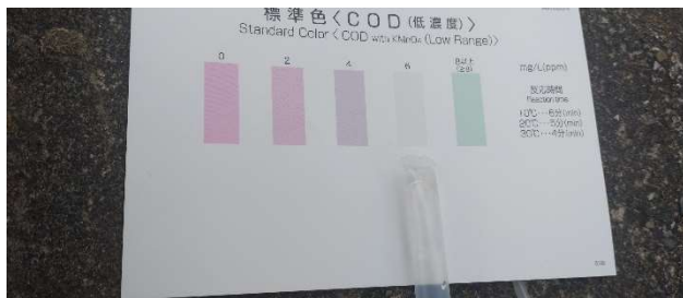
測定 1 回目