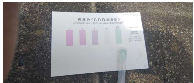
測定 2 回目