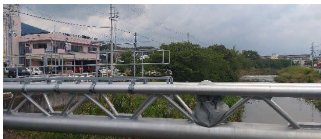
生駒市小瀬町 10-2 生駒市消防団機動第 3 分団 前