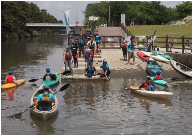
2018 年 写真3