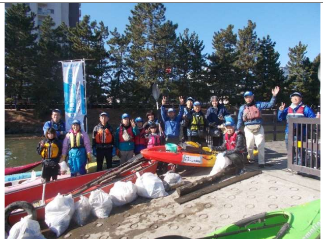
2020 年 写真8