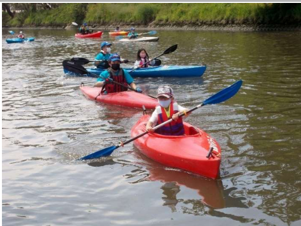
2021 年 写真 9