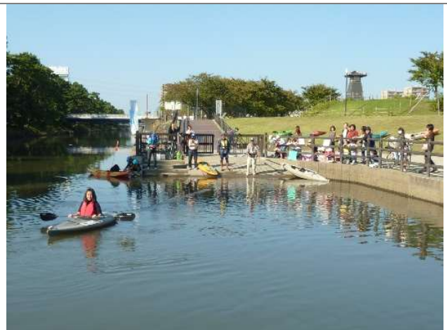
2018 年 写真4