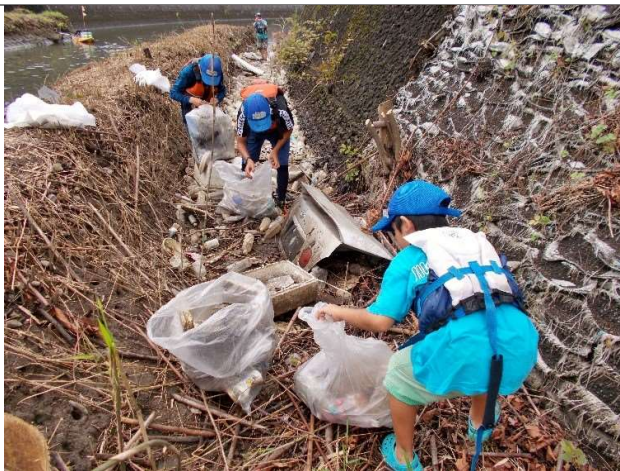
2018 年 写真5