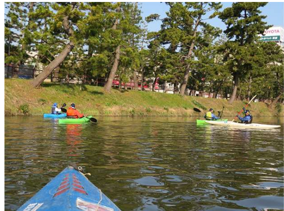
2023 年 写真 12