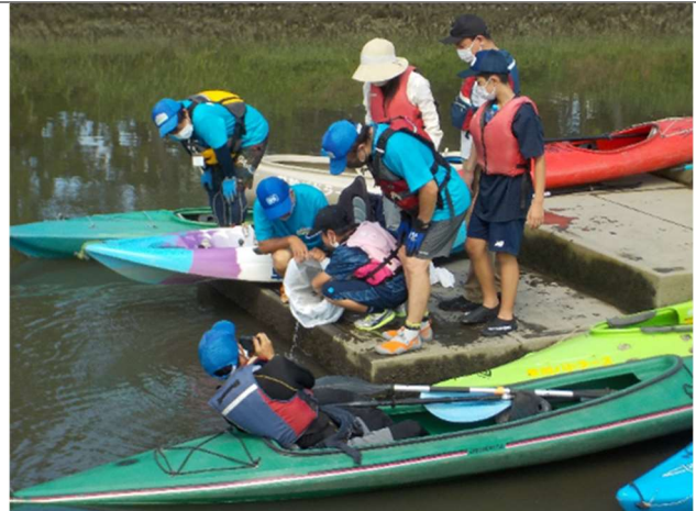
2022 年 写真 10