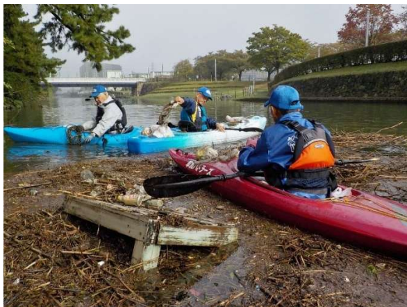
2019 年 写真7