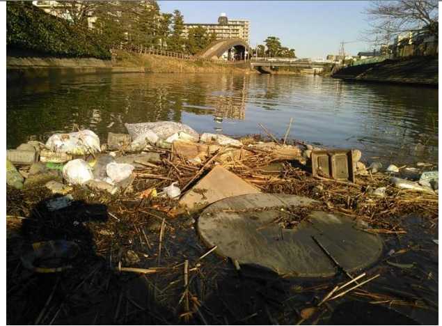
2017 年 写真2