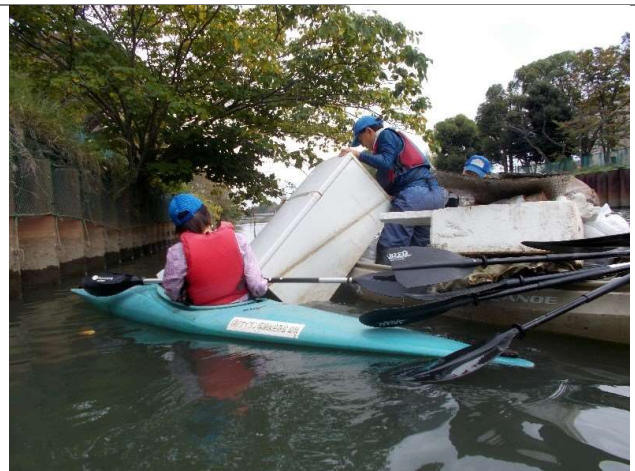
2019 年 写真6