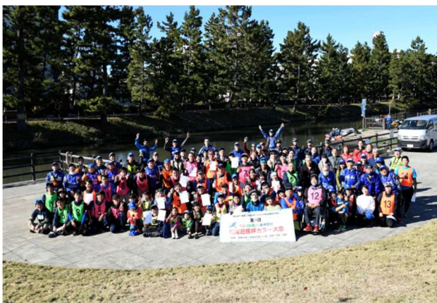
2022 年 写真 11