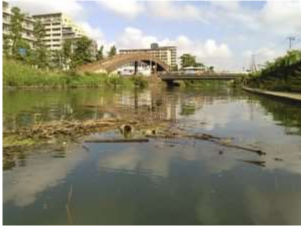
2016 年 写真1